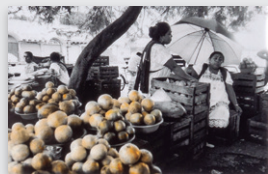
Página opuesta, arriba: Alicia D' Amico (Argentina, 1933 – 2001) Sin título, de la serie Instituto de Salud Mental , 1966 Plata gelatina 17.5 x 23.5 cm