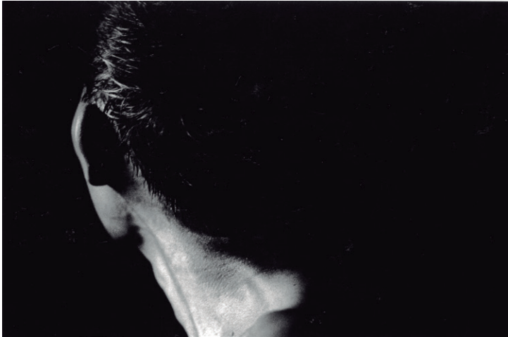
Abajo: Claudia Andujar (Suiza, 1931) Sin título, sin fecha Plata gelatina 18.6 x 28.1 cm