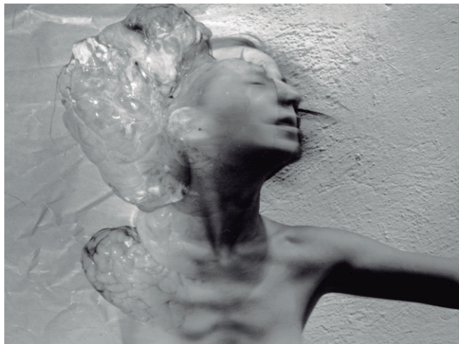
Renata von Hanffstengel (Alemania, 1936 – México, 2018) En conflicto , de la serie La mujer en su tejido , 1988 Plata gelatina 28.9 x 19.2 cm