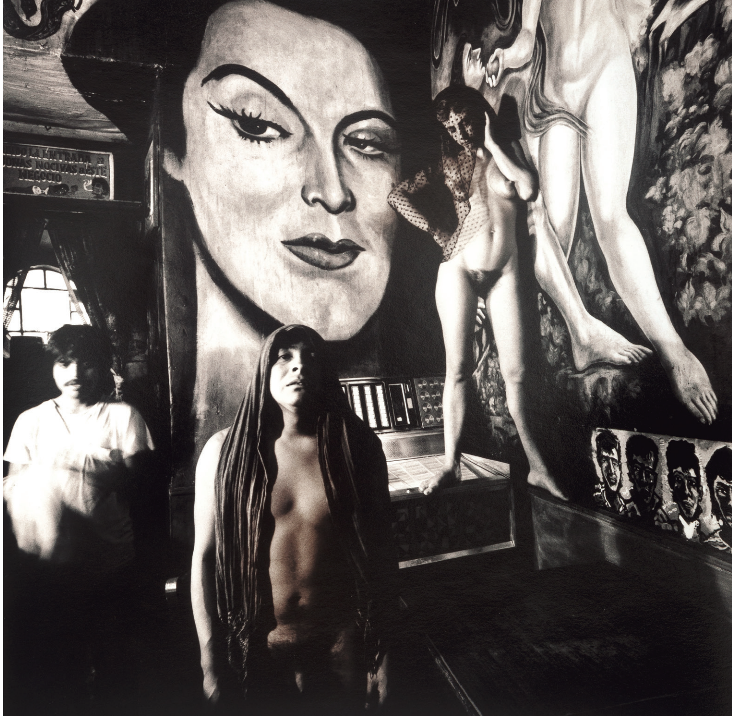
Oweena Fogarty (EE.UU., 1952) El incendio , de la serie Iniciación , 1987 Plata gelatina 26.1 x 25.6 cm