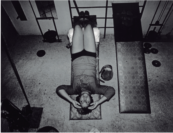
Arriba: Lourdes Grobet (México, 1940) Tania la Guerrillera haciendo ejercicio en el gimnasio , 1980 Plata gelatina 17.7 x 23.3 cm