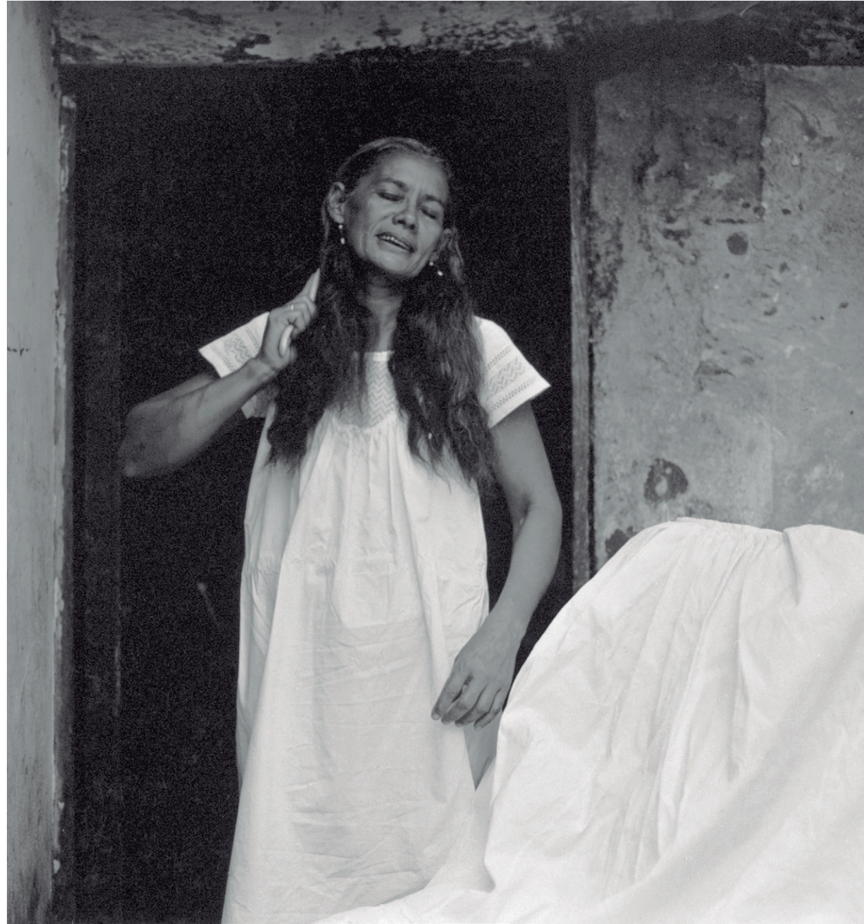
Mariana Yampolsky (EE.UU., 1925 – México, 2002) Veracruz , 1974 Plata gelatina 19.3 x 19.1 cm