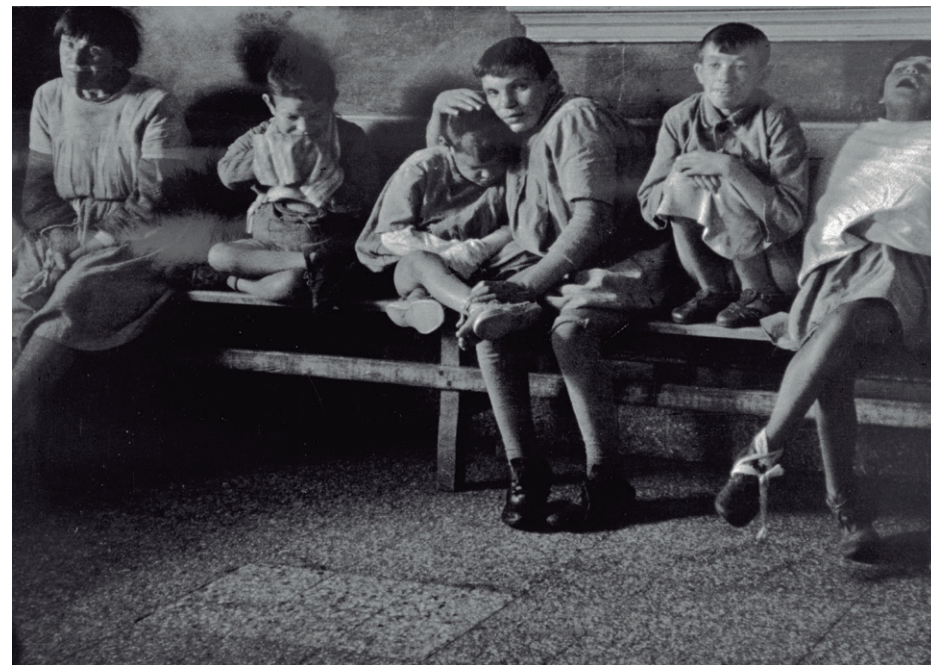
Derecha: Rosa Gauditano (Brasil, 1955) Prostitutas , 1976 Plata gelatina 18.4 X 27 cm