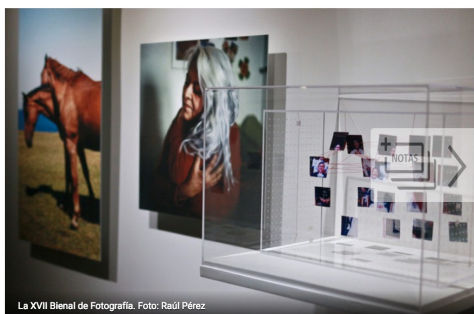
La XVII Bienal de Fotografía.