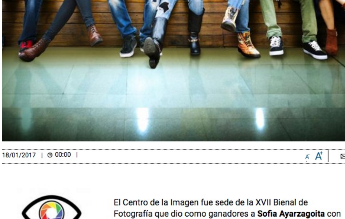
18/01/2017 | 00:00

El equipo de nuestro colectivo invitó a 10 estudiantes de fotografía, (todos menores de 20 años) a visitar el Centro de la Imagen esta semana para conocer su opinión sobre los trabajos ahí expuestos en el marco de la Bienal de fotografía. Este es el resultado en sus propias palabras. (Primera de dos partes) Los invitamos a conocer la obra de todos los seleccionados y visitar la exposición allá en la Ciudadela.