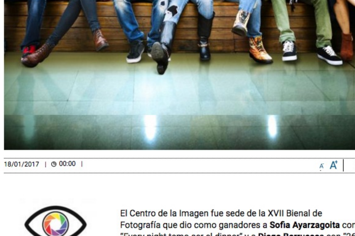
18/01/2017 | 00:00

El equipo de nuestro colectivo invitó a 10 estudiantes de fotografía, (todos menores de 20 años) a visitar el Centro de la Imagen esta semana para conocer su opinión sobre los trabajos ahí expuestos en el marco de la Bienal de Fotografía. Este es el resultado en sus propias palabras. (Primera de dos partes) Los invitamos a conocer la obra de todos los seleccionados y visitar la exposición allá en la Ciudadela.