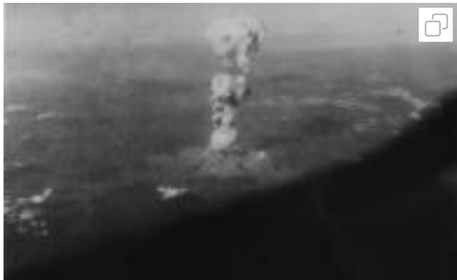
Revelan fotografías de Hiroshima tras lanzamiento de la bomba atómica