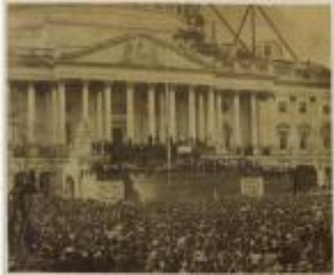
¿Cómo fue la investidura de Abraham Lincoln?