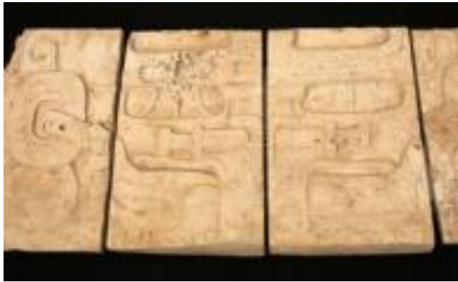
Guatemala recuperó 22 piezas arqueológicas robadas