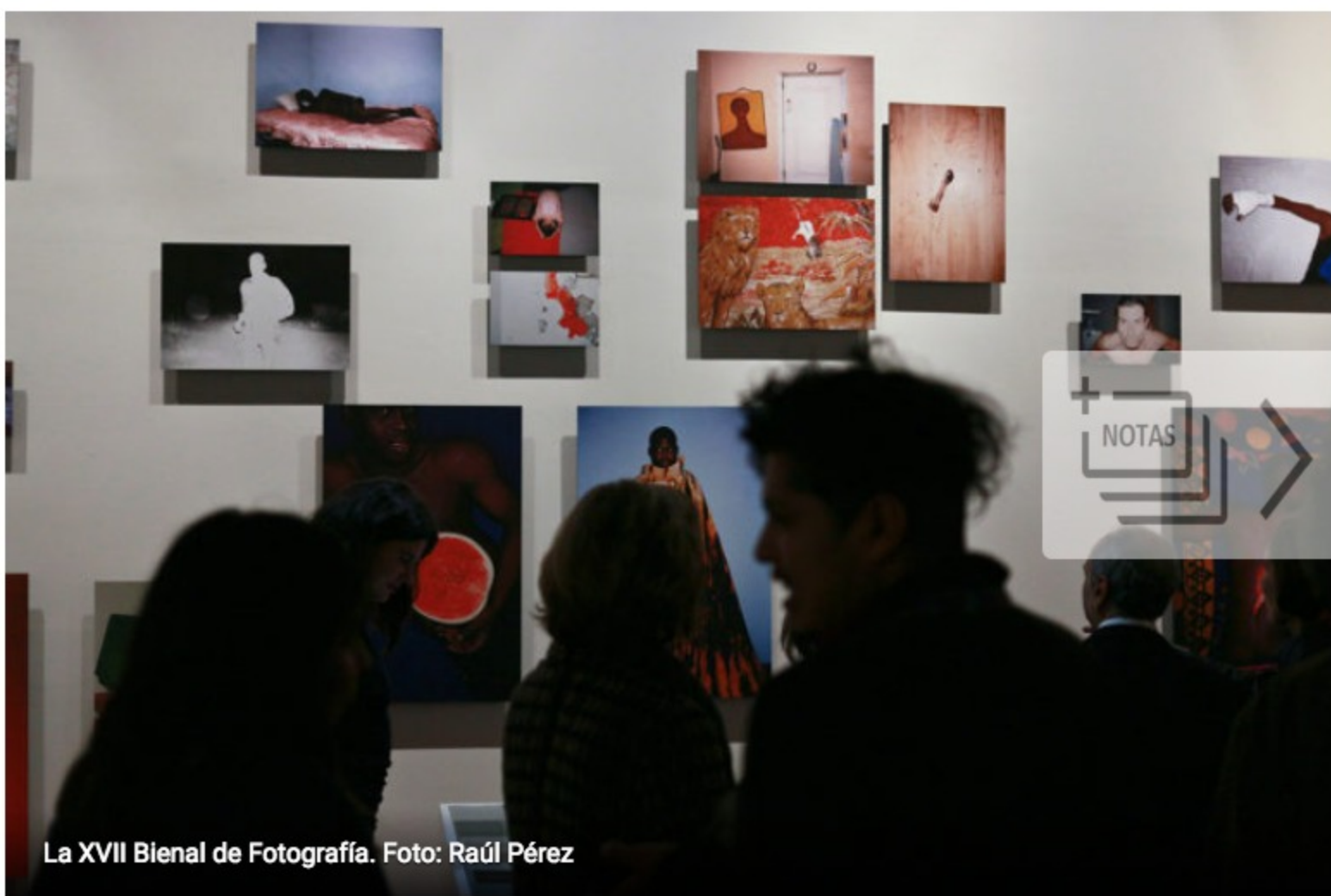
La XVII Bienal de Fotografía.