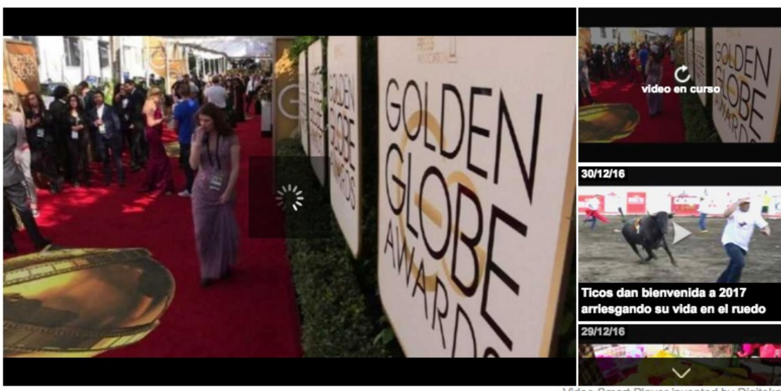
Video Smart Player invented by Digitalka