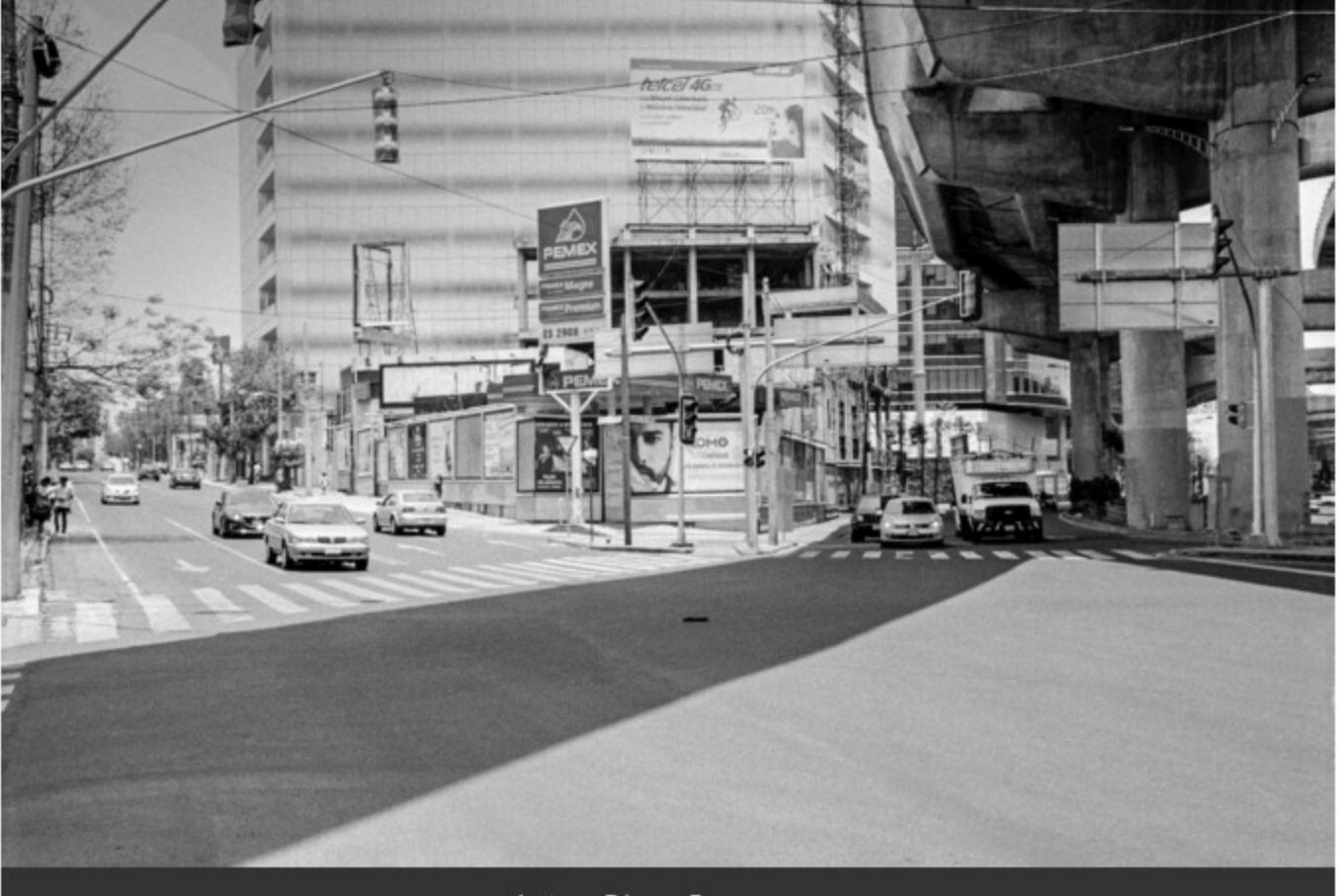
Autor: Diego Berruecos

24 Used to Be Gasoline Stations in Mexico, de Diego Berruecos, serie que muestra el abandono de gasolineras en distintos sitios de la república por la grave crisis económica que sufre Pemex. Es ganadora del mismo premio de Adquisición Arca, de $120,000 y el premio otorgado por Cannon México canjeable en equipo.