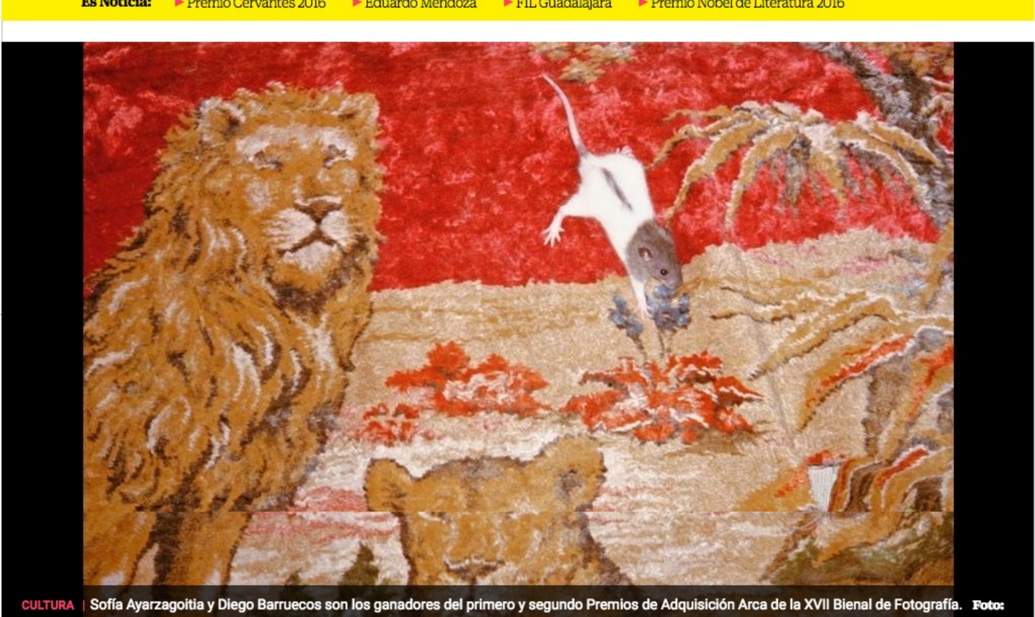
CULTURA | Sofia Ayarzagotia y Diego Berruecos son los ganadores del primero y segundo Premios de Adquisición Arca de la XVII Bienal de Fotografía.