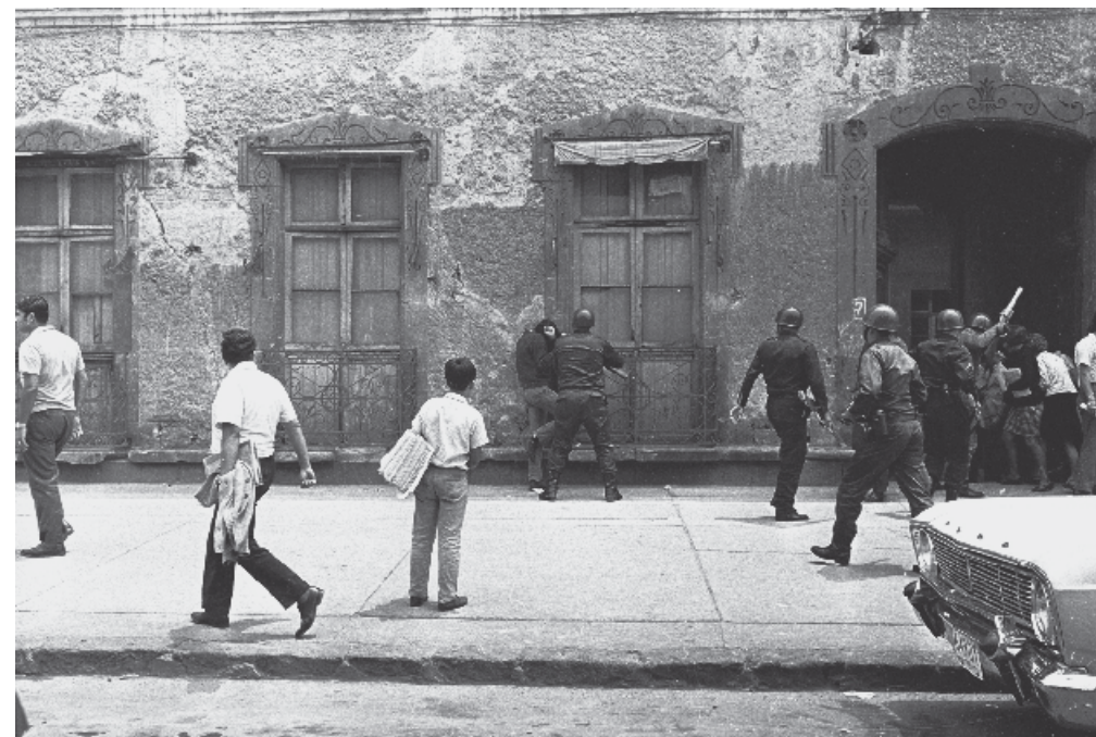
Estudiante de la vocacional 2 del IPN, es agredido por granaderos en las inmediaciones de La Ciudadela, el 22 de julio de 1968. La víctima de la violencia policiaca, Ernesto Zedillo Ponce de León, llegaría a ser Presidente de la República en el sexenio 1994-2000.

1968 El 22 de julio un grupo de estudiantes de la escuela vocacional número 2 del Instituto Politécnico Nacional y de la preparatoria Isaac Ochoterena, incorporada a la UNAM, se enfrentan a golpes al finalizar un partido de fútbol americano. La riña tuvo lugar