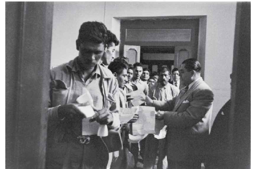
PÁGINAS 48-51: Hermanos Mayo. Aspirantes a braceros en el Centro de contratación de La Ciudadela, ubicado en Manuel Tolsá número 6, ca. 1945. Archivo General de la Nación.