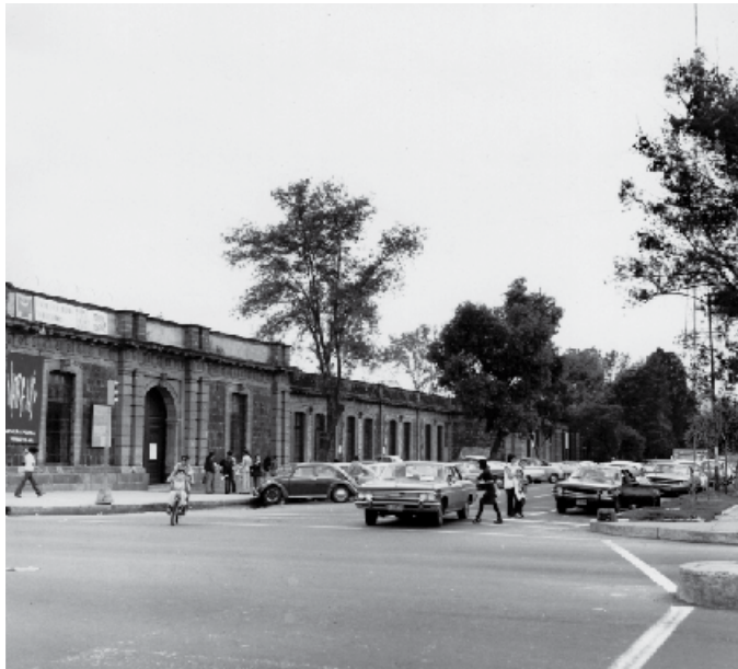
Vistas de la Escuela de Diseño y Artesanías (EDA) tomadas el 16 de julio de 1976. A la extrema izquierda un rótulo anunciando una exposición del caricaturista Rogelio Naranjo.