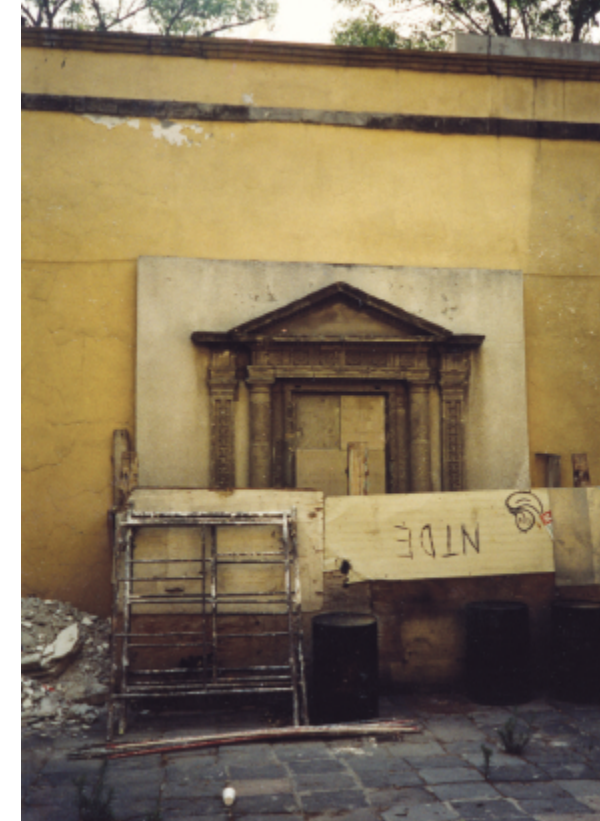
PÁGINAS 69-70: Estado que guardaban los interiores de La Ciudadela, previo a la intervención arquitectónica que se hizo a este edificio para albergar las instalaciones del Centro de la Imagen, 1993.

1994 El 4 de mayo el Centro de la Imagen inaugura sus instalaciones con la