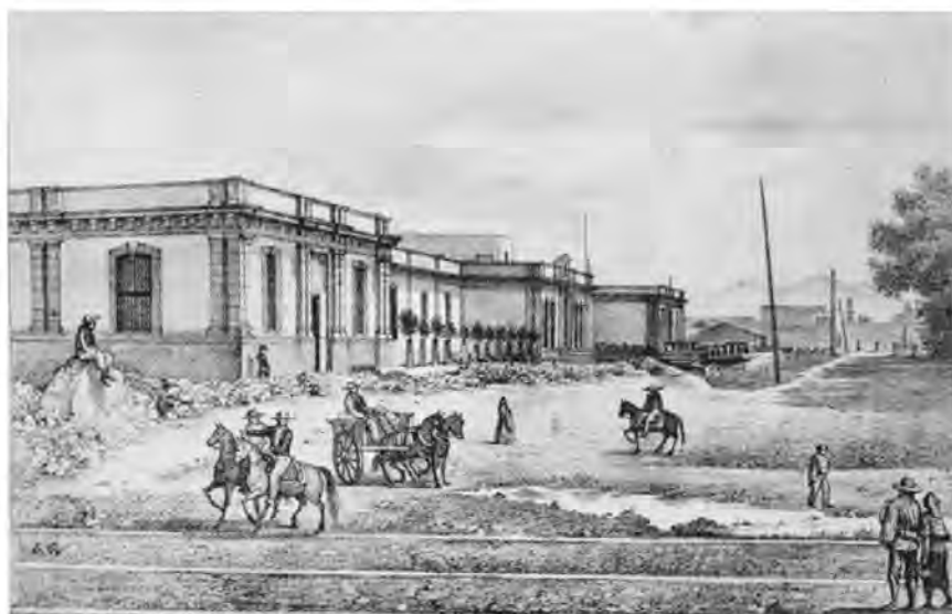
ARRIBA: La Ciudadela en un apunte litográfico atribuido a Luis Garcés, ca. 1882. En primer plano aparece el acueducto de Chapultepec, cuyos arcos fueron construidos por Nezahualcōyotl.