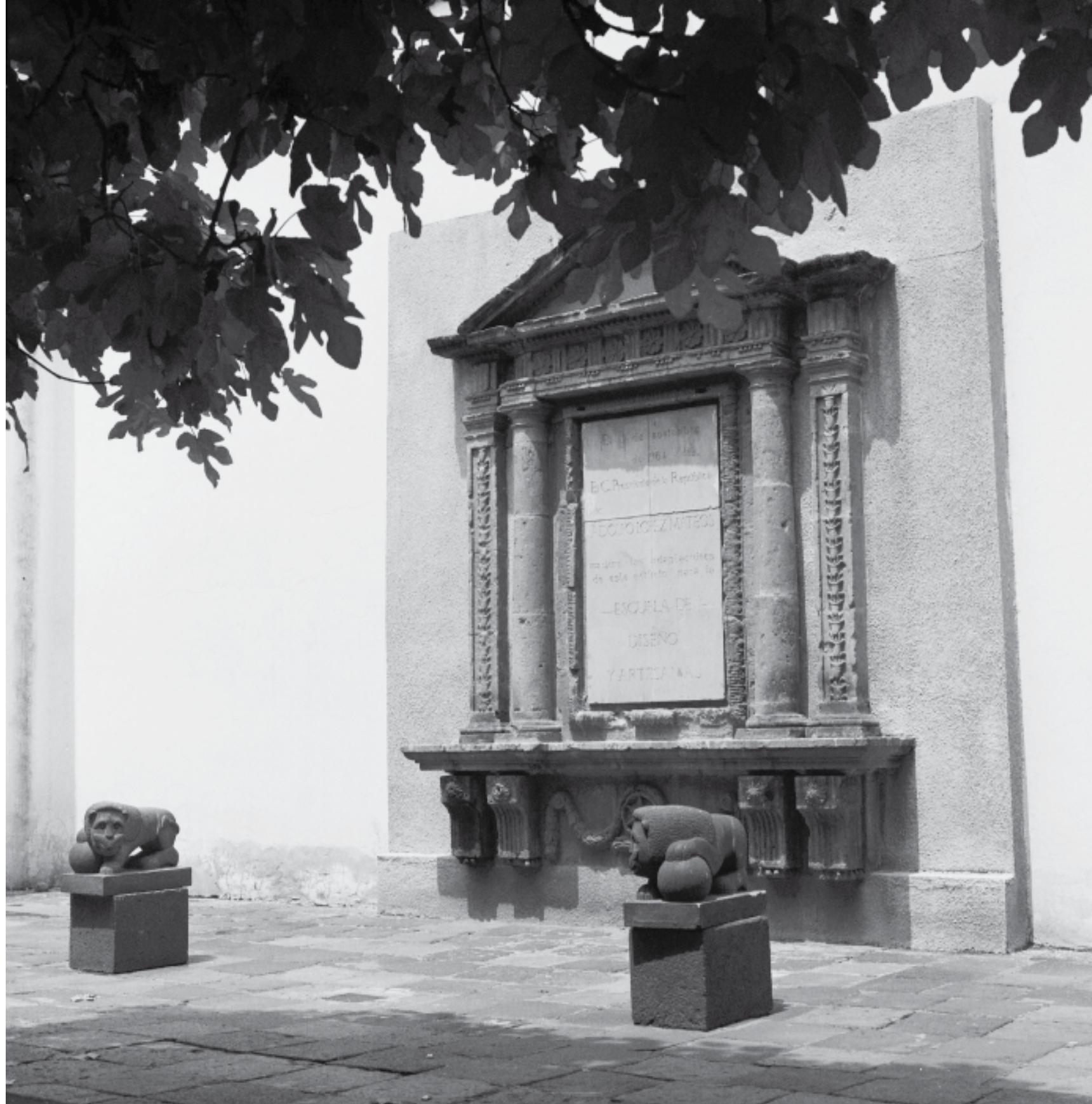
DERECHA: Rubén Pax . Vista de uno de los patios de la Escuela de Diseño y Artesanías, ca. 1976.