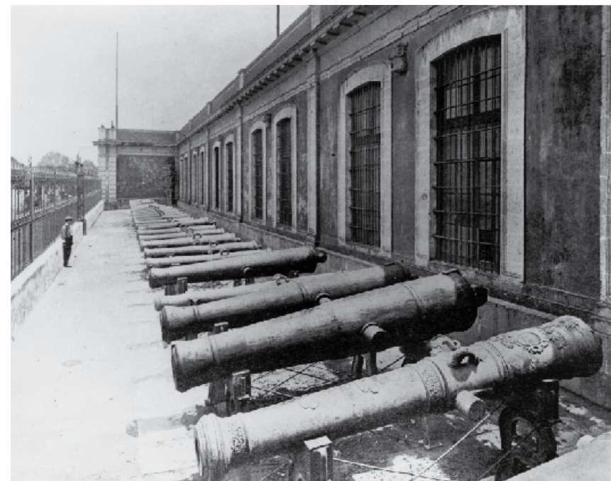
ABAJO: Cuartel Norte de la Ciudad, ubicado en el edificio de La Ciudadela, ca. 1925. Fototeca Constantino Reyes-Valerio de la CNMH-CONACULTA-INAH-MEX.