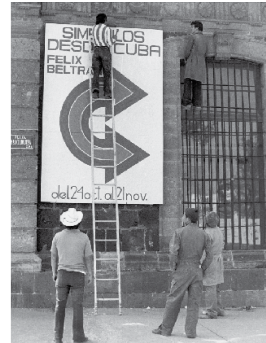
ARRIBA: Entrada a la EDA por avenida Balderas 125, ca. 1978, y una vista del exterior de la Escuela, al colocarse un cartel que anuncia la muestra Símbolos desde Cuba de Félix Beltrán, ca. 1986. Archivo histórico de la Escuela de Diseño, INBA.